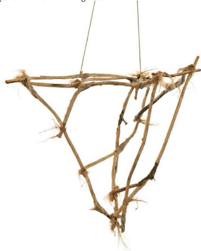
Drömfångare tillverkad utav armeringsjärn, akrylkomposit och fint bös. 45x57x47cm.

Verket kommer att vara utformat som en installation bestående av ett antal träd som står tätt placerade i en klunga. Uppe i träden hänger drömfångare och på marken ligger stenar utplacerade i cirkelformationer och i små högar. Alltihop skapar tillsammans en slags andlig plats som ger sken av att ha funnits där långt innan Hagastaden byggdes. Som om hela stadsdelen har byggts runt denna plats som har sparats på grund av sitt höga andliga värde. Att befinna sig mitt i denna dunge kommer att föra tankarna till svunna tider och parallella verkligheter.