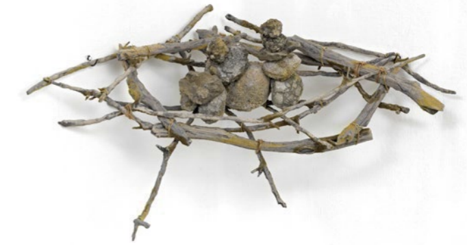
Nest 2014. Polyuretanskum, papier mache. 15x60x50cm