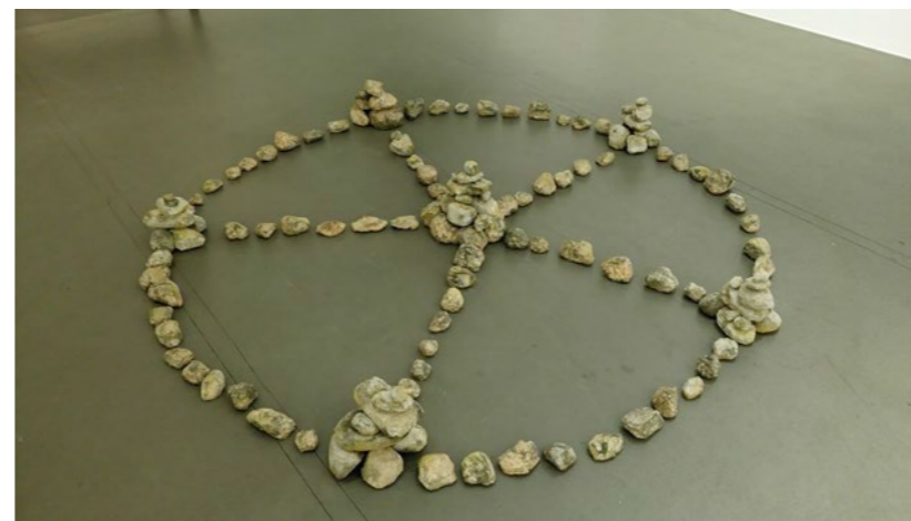
Stencirkel tillverkad utav skumgummi, betong, epoxy